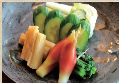
自家製漬物盛り合わせ ※季節によって内容が異なります