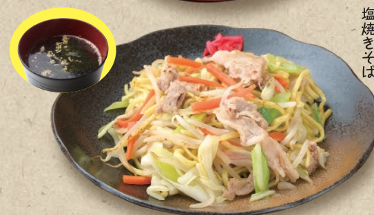
西園寺 塩焼きそば