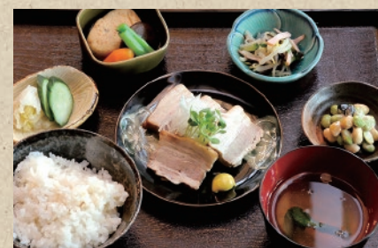
※小皿は日によって異なります おばんざい定食