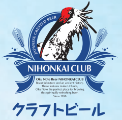
奥能登ビール 日本海倶楽部