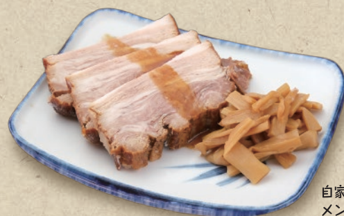
自家製チャーシューと メンマの盛り合わせ