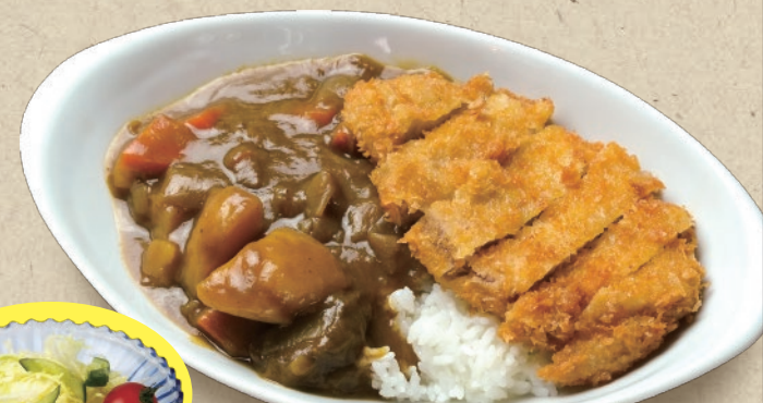
昔ながらのカツカレー [サラダ付]