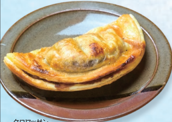
クロワッサン ミニたい焼き