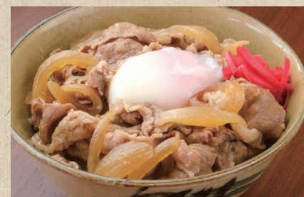
特製温玉牛丼定食