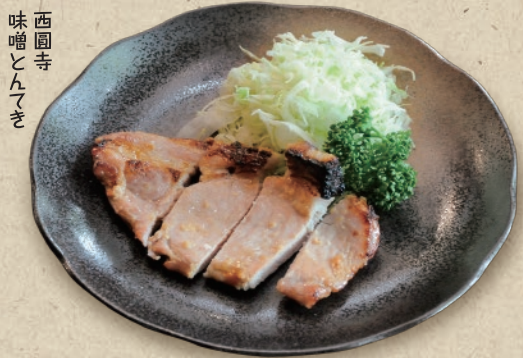
西園寺 味噌とんてき