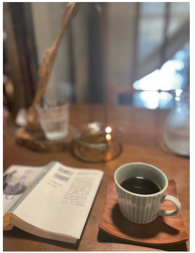
神音カフェにて傍らに「宿無し弘文十ステイプロジェクトの禅僧」柳田由紀子著・集英社

若神子原 もしみこはらにあれば 其身甚清浄 そのみはなほだしようじょうにして 不染世間法 せけんのほうにそまらぬこと 如蓮華在水 はずのはなのみず(泥水)にあるがごとし (良)